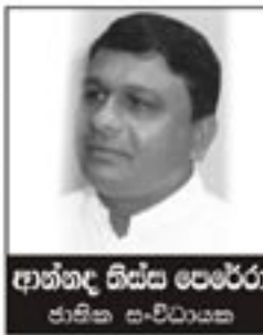
ආන්තද විශ්ව පෙරේරා ජාතික සංවිධායක

ලෙස ප්‍රජා පාලනය බල ගැන්වීමේ ක්‍රියාව සඳහා සුරැකවුවත් ඇති වී තිබේ. විශේෂයෙන් මෙය නොසලකා කිසිම දේශපාලන පක්ෂයකට රටේ ජනතාවට විමුක්තියක් සහනයක් ලබාගැනීමට යන මාර්ගයට පිවිසිය නොහැකි බව අපි දැඩි ලෙස ප්‍රකාශ කරමු.