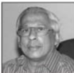
බැට් විරනෝන් ල.ස.ස.ප. දේශපාලන සහිත

සෑදීම හැකිවීම නොහැකි වීමය. මේ කන්තාවය තුළ යුද වියදම් අධික වන අතර එක්සත් ජනපද ඇමරිකාවේ මුළු ධානික සහන යුදවාදී යන්ත්‍රණයට අප රට ද කෙරෙහි මැද දැමිය. ලෝක මූල්‍ය ආයතන වලට අධික පොලියක් මින ගිය හැකිවිය. රටේ කැපැරී කිසිවක් නොමැතිව ප්‍රශ්න සිටිවීමට අවශ්‍ය අවධානය සහ මූල්‍ය ආයෝජනය කිරීමට නොහැකි වීමය. පොදු මාධ්‍යය කන්තාවයේ අධ්‍යාපනය, ළමා ඇතුළු අනා