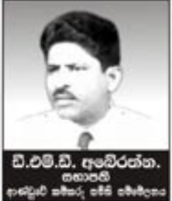
ඩී.එම්.ඩී. අබේරත්න, සභාපති, ආණ්ඩුවේ නීතිඥ, පීසී පීසී සමිතිය

යුධ විසඳීම හා අවසාන වුවත් නවීන කිරීමේ බරද ජනතාවට පැවරී ඇත. එක්සත් ජාතික පක්ෂය මෙහිදී කර ඇතැම් පිළිවෙලක් අනුගමනය කරන බවක් පෙනී යයි. මේ ආණ්ඩුව බලයෙන් ඉද දමා බලයට එමී එකම අරමුණින් එ . ජ . ප . ක . ස . ය ක්‍රියාකිරීමෙන් ජනතා අප්‍රසාදයට මුහුණ ලක්වී තිබේ. මුහුණගේ ක්‍රියා පිළිවෙල උතුරේ මෙන්ම දකුණේ ජනතාවද රැවටීමකි. කුටුකුටු බලයට නතු වී දීමටම සිලිනවාද යන ප්‍රශ්නය ගැන අවසානවුවත්ම යම් පවිසිවයක් හෝ දී ඔවුන් දැනුවත් කිරීමටත් ආණ්ඩුව උනන්දුවක් ගෙන නොමැත. ඉකුත් ජනාධිපතිවරණයේ දී මහින්ද වික්‍රම විදාමන වැඩසිටුවීමට ජනතාව දැක්වූ සහය පරදු